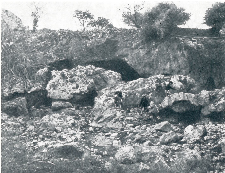
Fig. 1. — Ingresso della grotta dei Puntali (Carini).