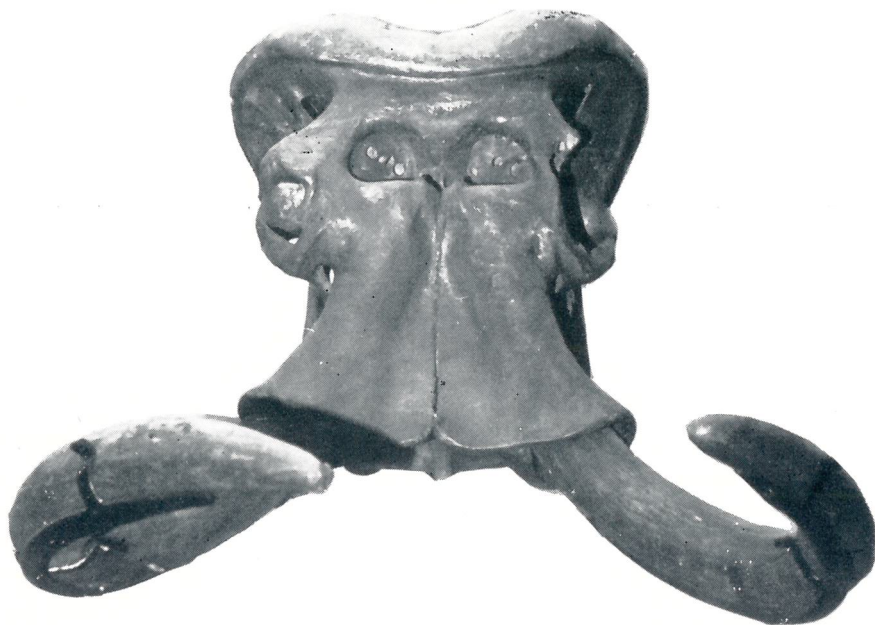
Fig. 3. — Elephas mnaidriensis ADAMS. Esemplare montato nel salone del Museo di Paleontologia dell'Università di Palermo (inv. n. 306/1).